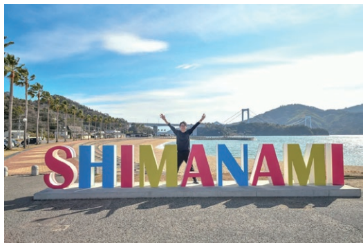
福岡 寿亮さん / 道の駅 マネージャー